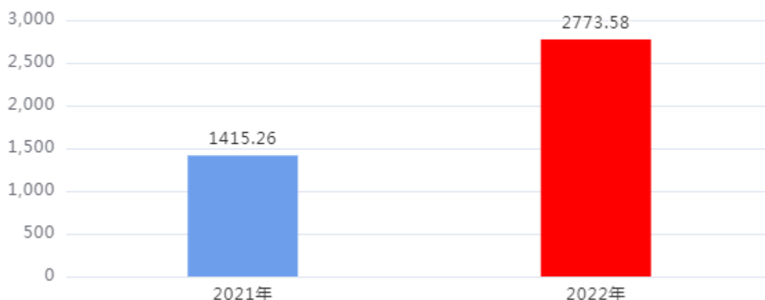
财政拨款收入、支出总计对比图 (单位：万元)

2022年度财政拨款收入总计、支出总计均为2,773.58万元，与上年相比收入总计、支出总计均增加1,358.32万元，增长95.98%，增长的主要原因是：市级水利发展专项资金增加。